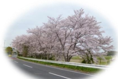
三木小学校近くの道沿いの桜並木

二班に分かれて、福美町の「桜の森公園」へお花見に行きました。二班ともお天気に恵まれてお花見日和でした。ちょっと時期が早めで満開ではありませんでしたが充分楽しめるくらいは咲いていました。懐りに「珈集」でお茶を楽しみました。どの年代でも女子会は大盛り上がり(●^o^●)楽しい一日となりました。