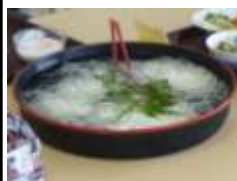
清涼感漂う... 桶そうめん 流れてないけど 結構人気です