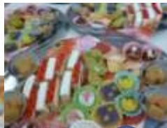
ケーキバイキング 女性に大人気♥