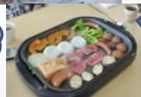
焼肉バイキング 締めは焼おにぎりで(^o^)